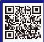
エゾシカとの衝突映像