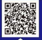
令和5年度版北海道全域国道におけるエゾシカ衝突事故マップ

一般社団法人 日本損害保険協会 北海道支部 | 北海道 | 北海道警察 国土交通省北海道開発局 | 北海道地区レンタカー協会連合会