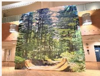
↑初山別村内森林の垂幕