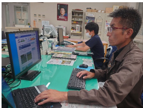
ホームページを活用した情報発信 (地域の問題を逐次提供)