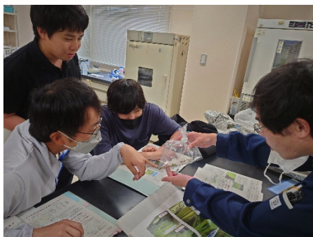
採取した害虫を確認しました (若手農業者の育成支援～座学～)