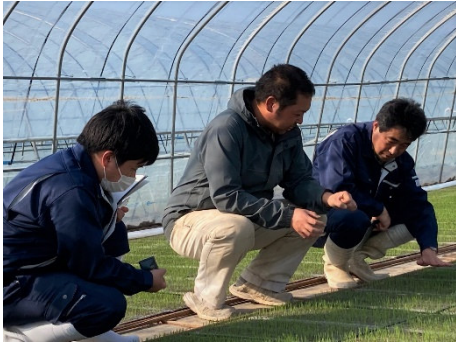
温度管理に気をつけましょう (水稲の育苗支援)