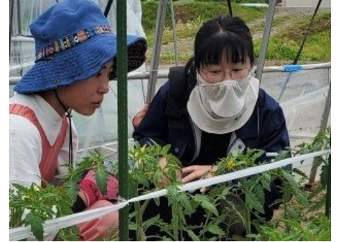
着果の仕組みを考えよう (新規就農者支援)