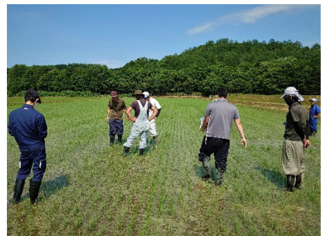
ほ場巡回による苗立本数調査 (水稲直播栽培の適期追肥支援)