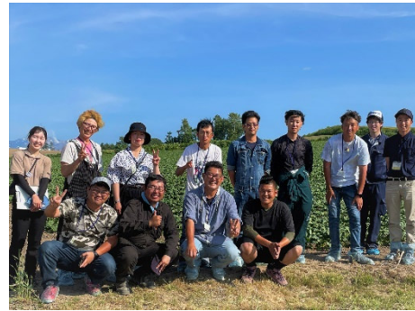
有意義な研修を終え皆さんにっこり (4Hクラブ連絡協議会の視察研修)