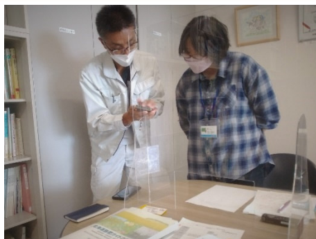
適正な施肥の推進 (クリーン農業の支援)