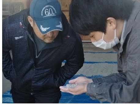
カルパーしっかりできています (重点地区の直播種子予措支援)