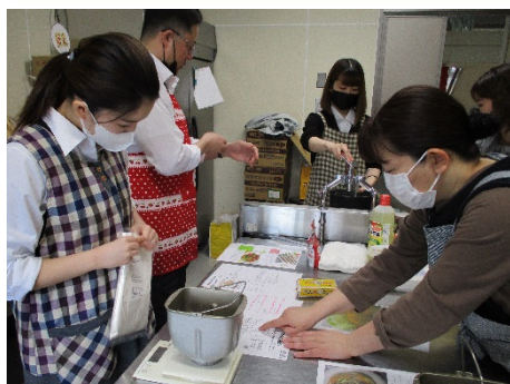
JARもいとの連携 (ホームページのレシピ試作)