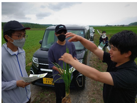
作物の生理生態を学びましょう (若手農業者の育成支援～屋外～)