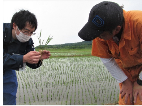
今は5葉後半ですね (水稲の生育状況説明)