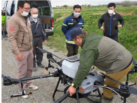
水稲直播ドローンは種で労働軽減 (重点地区の別苅クラブ活動支援)