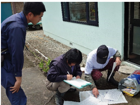
土壌診断に基づく施肥を検討 (重点地区の水稲安定生産技術支援)