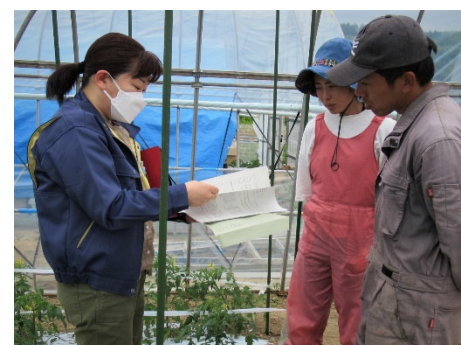
高付加価値化の志向者への支援 (6次化助成事業の情報提供)