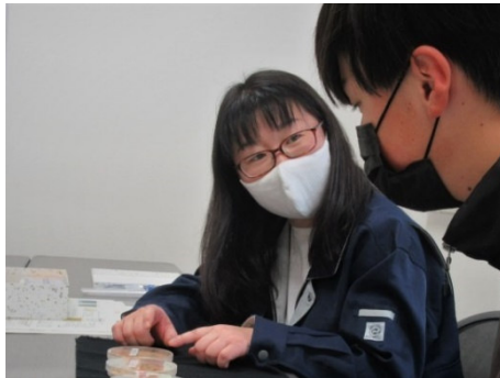
作物の生理生態を学ぼう (若手農業者の育成支援)