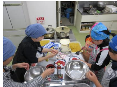
初山別村「子ども・地域生活習慣向上プロジェクト事業 通学合宿」調理体験の様子