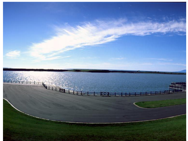
天塩町河川公園 (天塩町)