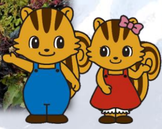
りっぶくん りっぶちゃん