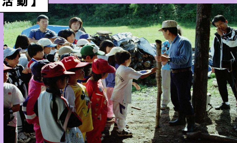
【炭焼き教室: 地元小学生】