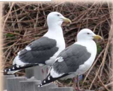
オオセグロカモメ

体長64cm。海岸や河川下流部に生息。脚はピンク。くちばしの先に赤い点がある。カモらしい鳴き声。止まっていると尾が黒く見えるが、黒いのは翼の先で、羽ばたくと尾が白いのわかる。