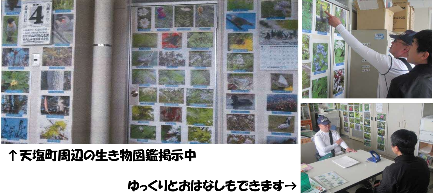
↑天塩町周辺の生き物図鑑揭示中