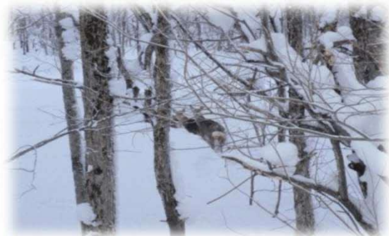
森林内を移動する エゾシカの家族