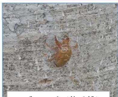
エゾハルゼミ(抜け殻)