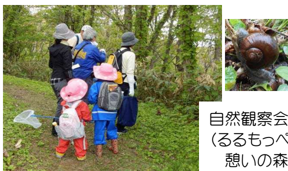
自然観察会 (るるもっぺ憩いの森)