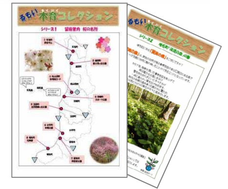
るるもい木育コレクションの発行 (管内木育情報の発信)

「るるもい木育サンタBOOKS」は、管内全17小学校に“木や森の本”を届ける取組だよ。 みんな、木や森が好きになってくれると良いなあ！