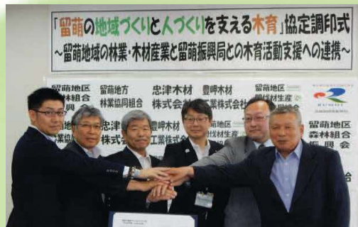
「留萌の地域づくりと人づくりを支える木育」 に関する協定（平成30年8月締結）