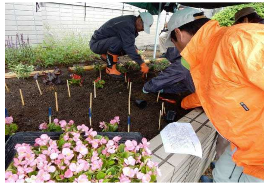
ガーデニング研修