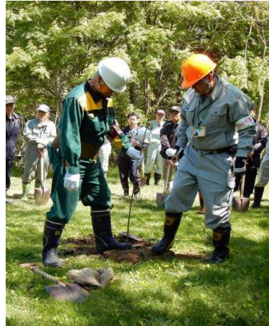
植樹会開催、植樹指導