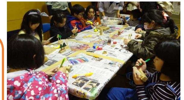
木工クラフト体験

“木育マイスター”は… 「木育活動」普及のため、木育活動の企画立案や指導、アドバイス、コーディネートできる人材を、北海道知事が「木育マイスター」と認定しています。道の木育推進のパートナーとして、地域の木育活動の中心となって活躍しています。