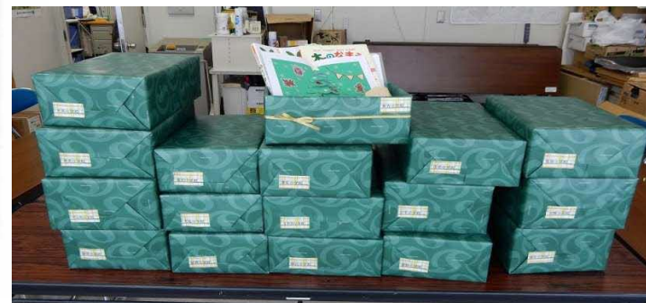
るるもい木育サンタBOOKSの取組