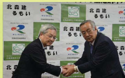
「木育の輪を広げる協働」に関する協定 （平成29年1月締結）