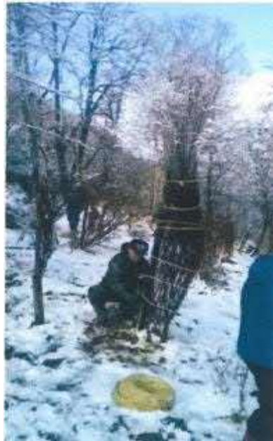
森林整備(冬囲い) 【るるもっぺ憩いの森】