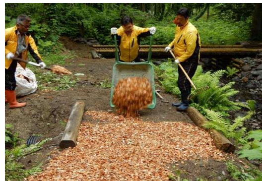
溪流の森 遊歩道 ウッドチップ敷設