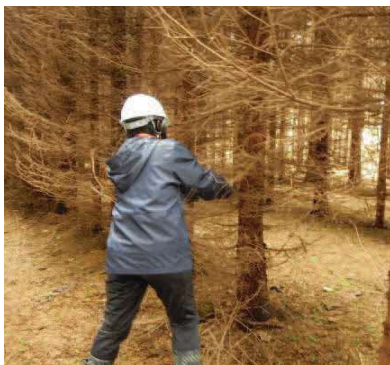
↑ 森林教室(枝打ち体験)