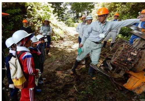
森林教室 (高性能林業機械見学)