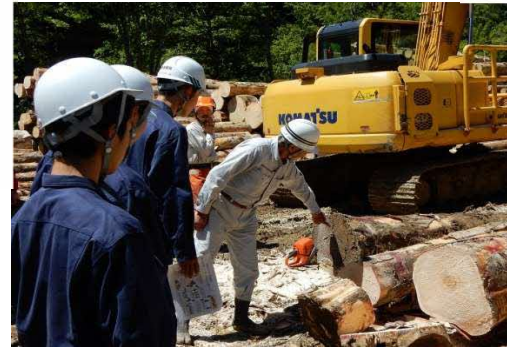
造材現場見学授業