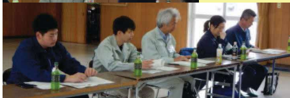
留萌みどりづくりネットワーク 総会