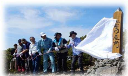
除幕セレモニー(平成30年9月)