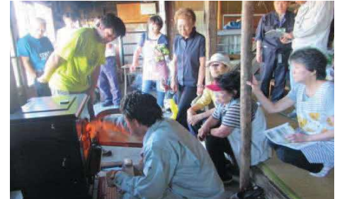
薪ストーブ利用の実証展示 (木材の利活用)