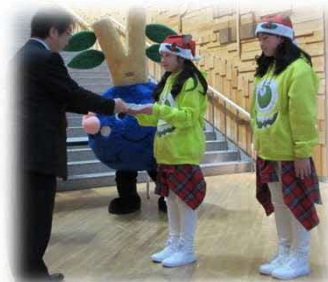
るるもい木育サンタBOOKS 贈呈式(平成29年12月)