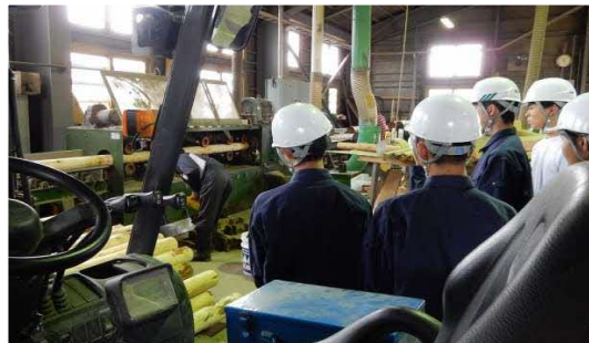
製材現場見学授業