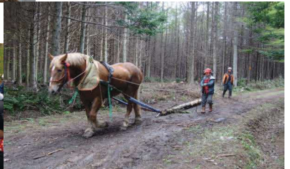
天売島を応援する専門家の方々も 【伐採木を馬で搬出(馬搬)】