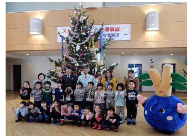
保育園児のクリスマスオーナメント作りルー (クリスマスツリー(トドマツ)の提供)