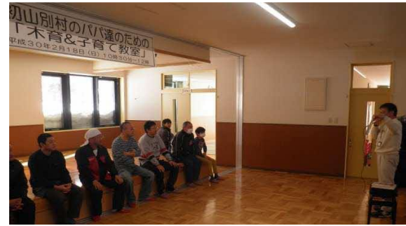
子育て中のお父さん向けの木育教室 (初山別村にて)