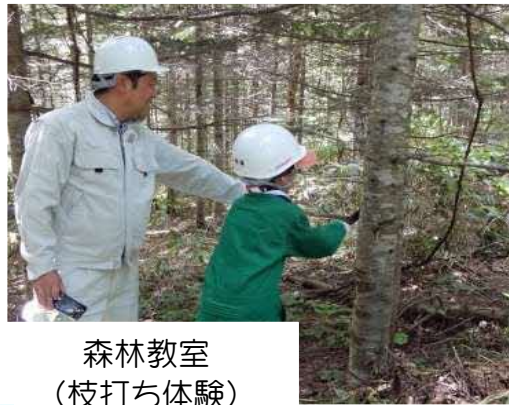
森林教室 (枝打ち体験)