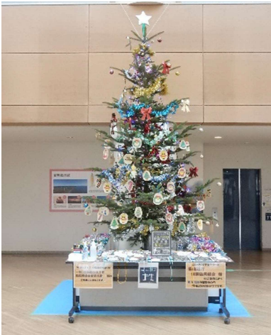
留萌合同庁舎のツリー

木育を推進する協定に基づき、ツリーのトドマツは留萌地方林業協同組合、電飾などの飾りは（一社）北海道森林土木建設業協会留萌支部からの協力を得ています。