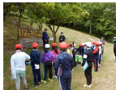
東光小学校（7月2日、10月15日）