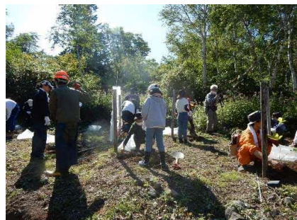
増毛山道トレッキング育樹体験 (増毛町 9月2日)