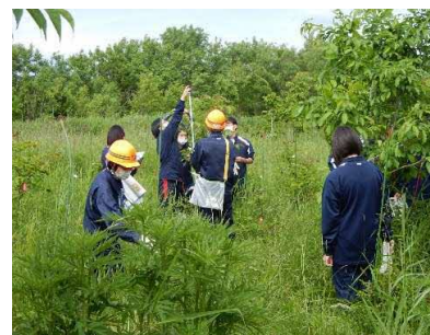
羽幌高校樹木調査（6月15日）