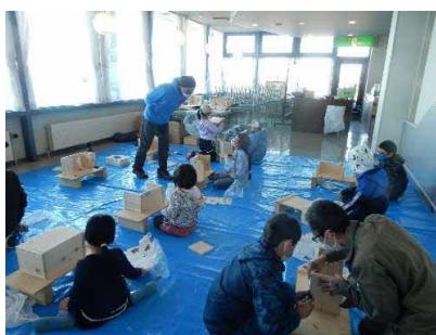
ふなば学校 木工クラフト体験 （留萌市 10月30日）