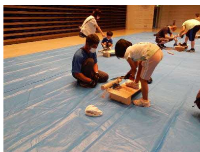
苫前町公民館講座「木育ひろば」 （苫前町 8月9日）

また、留萌市の住宅型有料老人ホームあやで、入居者を対象に松ぼっくりなど自然素材を使ったリースづくりを実施しました。