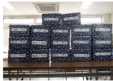
小学校に届ける本