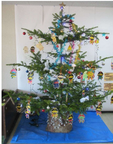
天塩合同庁舎のツリー