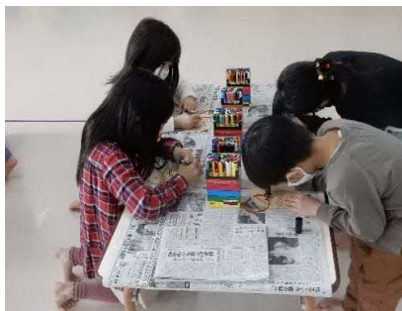
オーナメントづくり （留萌市 12月7日）

天塩合同庁舎では、こども園の園児の代表が、作製したオーナメントをツリーに飾り付けました。