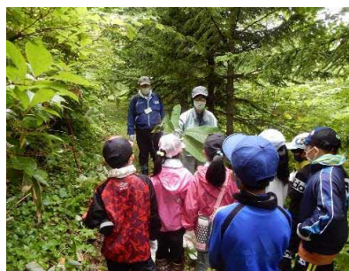
潮静小学校（7月7日、9月21日）