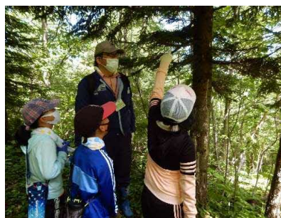
港北小学校（6月30日、9月15日）

また、羽幌高校の生徒が羽幌町ビオトープ自然空間はぼろで行った樹木調査で、樹種の判別方法等を指導しました。