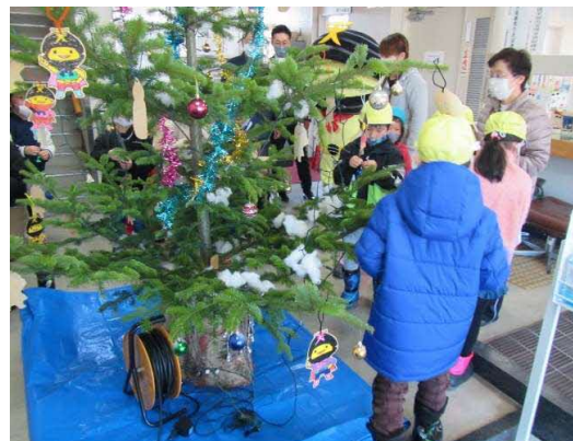
天塩合同庁舎のツリー飾りつけ （天塩町 12月8日）