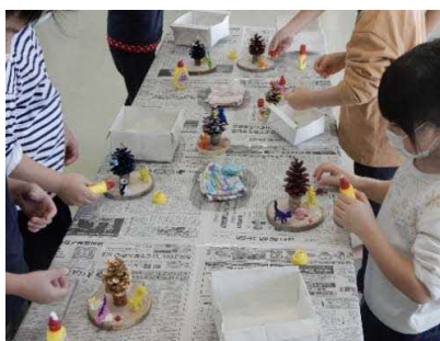
ミニツリーづくり （留萌市 12月9日）