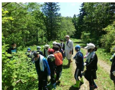
増毛小学校（6月23日、9月17日）