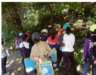
留萌小学校（7月19日、11月4日）