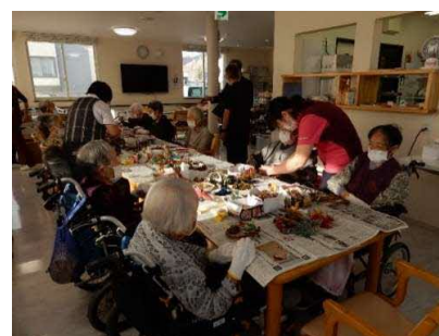
老人ホームあや リースづくり （留萌市 11月17日）