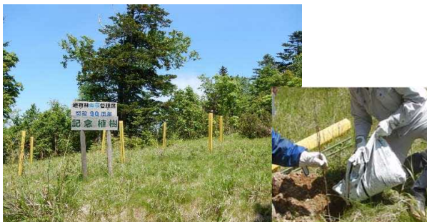
るもいの森をまるごと体感！！ (留萌市 6月2日)

令和3年度は、留萌管内では道北圏域木育フェスタとして多くのイベントを企画しましたが、新型コロナウイルス感染症のため中止や規模の縮小が相次ぐなか、留萌市るもっぺ憩いの森で補植を行う「るもいの森をまるごと体感！！」と、増毛中学校の生徒が増毛山道のトレッキングと合わせて補植を行う「増毛山道トレッキング育樹体験」を実施できました。