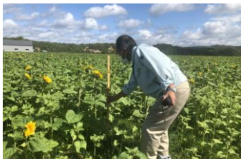
緑肥栽培支援 (生育状況の把握)