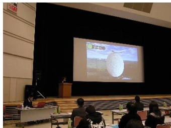
遠農生のプロジェクト発表