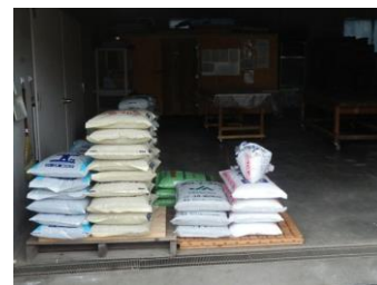
肥料の保管状況を確認