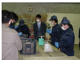
ばれいしょの袋詰め 作業を確認