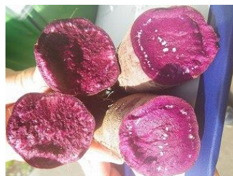
紫さつまいも（断面）