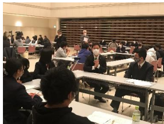
遠農生とのグループトーク