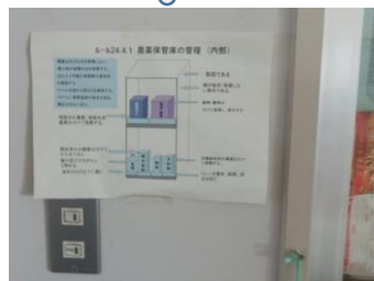
農薬保管庫の 管理方法を提示