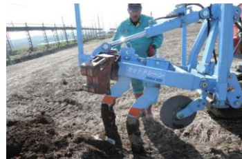
排水性改善支援 (カットドレーンの施工)