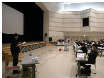
各組織の取り組み紹介