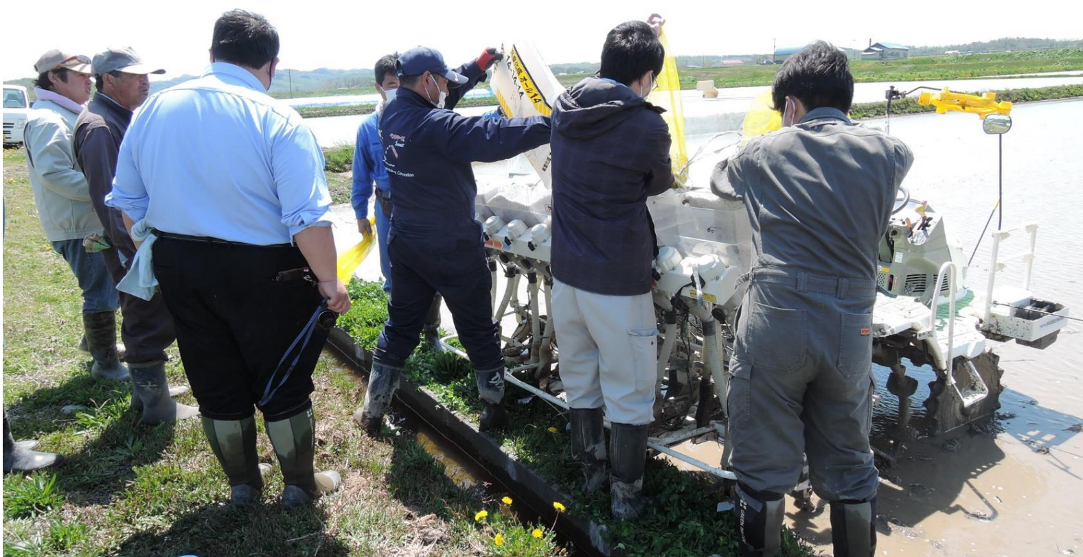
羽幌町築別第2地域 水稻の直播作業