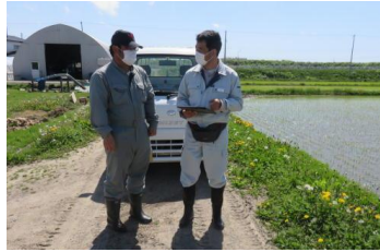
機械利用の聞き取り 機械貸出票を作成し提案