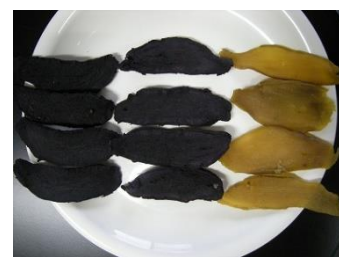
新たな用途の開発