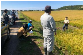
湛水直播の現地研修会 (調査をもとに情報提供)