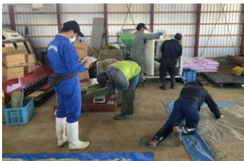
適切な種子予措支援 (カルパー粉衣)