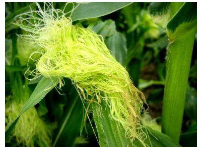
花から出た花ふんが毛につくと、 「とうもろこし」の実ができます