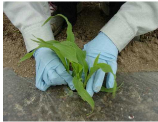
葉っぱが3まい出たら元気の 良いものを1本えらび、 そのほかはのこす「とうも ろこし」の根をキズつけな いように、とりのぞきます