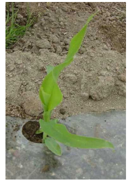
1本だけに なりました