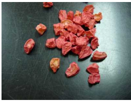
2～3つぶ、 種をまきます