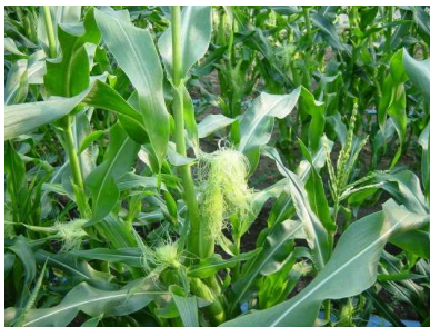
「とうもろこし」の実になる部分が、 大きくなると先から毛が出てきます