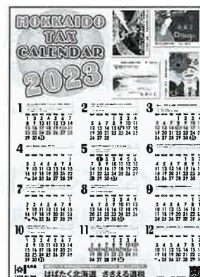
2023年 道税カレンダー