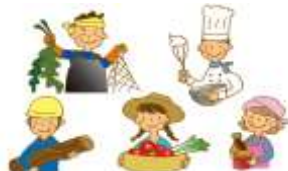
地域ぐるみで魅力発信