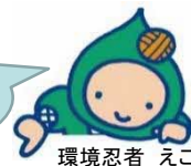
環境忍者 えこ之助