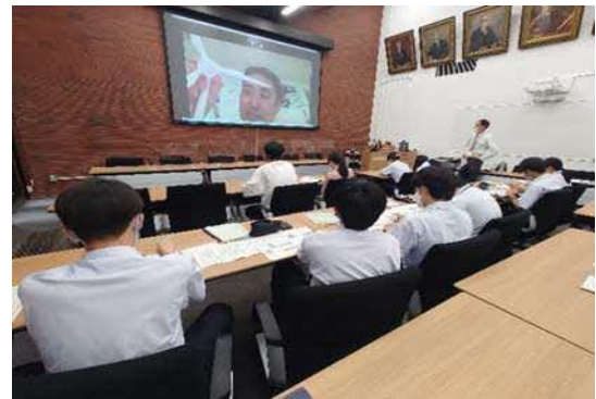
留萌高等学校・北海道大学SDGs・ゼロカーボンプロジェクトの様子