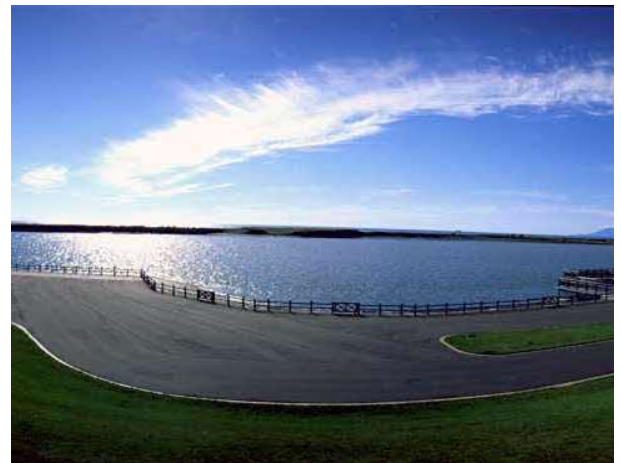
天塩町河川公園 (天塩町)