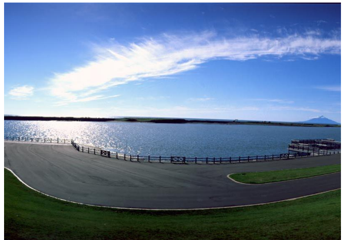
天塩町河川公園 (天塩町)