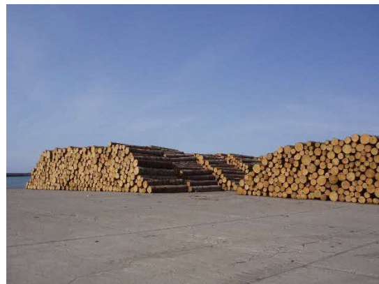
【留萌市】移輸出向けトドマツ材（留萌港）