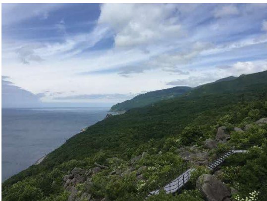
【増毛町】雄冬岬展望台からの景色

また、若年層を中心とした人口の流出による高齢化が顕著で、管内全市町村が過疎地域の指定を受けています。