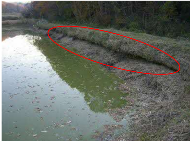
【堤体上流法面などに損傷や浸食箇所がある】