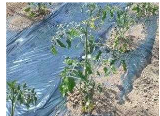
ミニトマトの花がさきはじめ たら苗を畑にうえます。