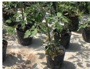
ポットにうえてから30日 くらいたった苗です。