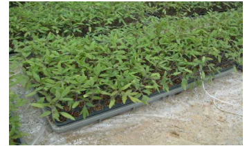
種をまいて25日くらいたった 苗。このくらいの大きさ になったら、大きなポット にうえかえます。