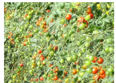
たくさんミニトマトがなります。 花がさいてから40～50日くらい たつとミニトマトは赤くなります。