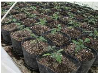
大きなポットにうえたミニト マトの苗です。