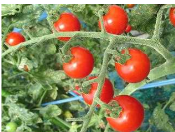
おいしく食べれるようになったら 枝から取って集めます。