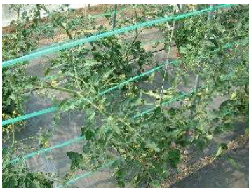
ミニトマトが大きくなってきたら、 倒れないように横にビニールテ ープをはり、ななめに引っ張るよ うにして、ミニトマトとビニールテ ープをひもでむすびます。