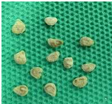
ミニトマトの種 （種の大きさ） 長さ3～4mm あつさ0.8mm