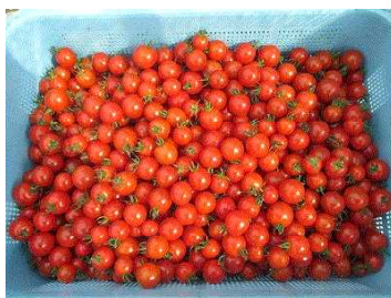
食べごろのミニトマトをコンテナ に集めます。