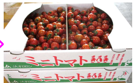
大ききごとにミニトマトを分けて、 はこに入れ市場に出して売られ ます。