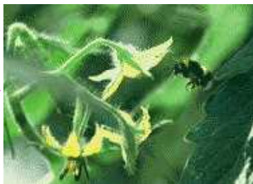
きちんとミニトマトができるよ うにマルハナバチというハチにメシ ベに花ふんをつける手伝いをして もらいます。