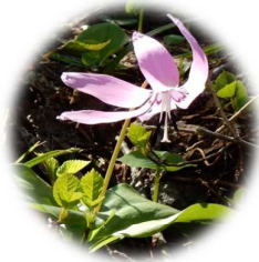
カタクリ(5月上旬撮影)