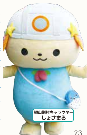
初山別村キャラクター しよさまる

しよさんべつ天文台 初山別村字豊岬130-1みさき台公園 TEL.0164-67-2539 休館火曜・12月～2月冬季休業