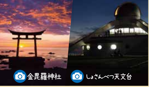
📷 金毘羅神社 📷 しよさんべつ天文台

初山別で外せないのが金比羅神社。海の中に建つ鳥居と夕陽は写真映え間違いなし。また天文台では、天体望遠鏡から見える星空を撮影できる。