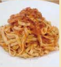
カフェ テイルウィンド

気軽に集まれる場所が少ない初山別に、多世代交流の拠点として誕生したカフェテイルウィンド。その看板メニューがこのパスタだ。