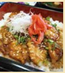
岬の湯レストラン花みさき

ホテル岬の湯の中にあるレストラン花みさきの名物ランチといえば、真ふぐ照り焼き丼。甘辛いタレがなじみ、ふぐのおいしさが味わえると評判だ。