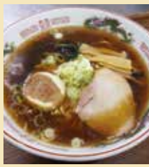
レストランともしび

初山別の真ふぐの出汁が豊かに香る、あつさりスープがやめられない。ふくだしラーメンは、もはや初山別名物といっても過言ではない。