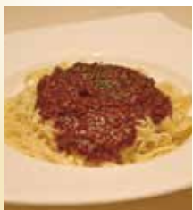
美食酒家 司 留萌市開運町3丁目5-7 TEL.0164-43-1002 11:00-14:00、17:30-24:00(L.O.23:00) 日曜休

おしゃれな店内で、地元食材を使用した創作料理を楽しめるお店。留萌産の希少小麦「ルルロツン」を使用したハスタも提供。