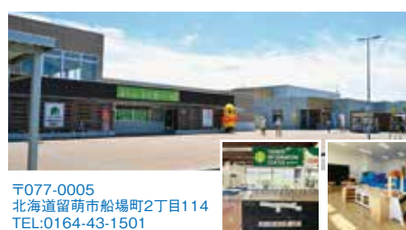
〒077-0005 北海道留萌市船場町2丁目114 TEL.0164-43-1501

オロロンラインを利用する方をはじめ、留萌地方を訪れる多くの方が立ち寄る道の駅。留萌港や市街地に隣接しており、7.8haにおよぶ広大な芝生広場で、パークゴルフやドッグランなどを楽しむことができる。観光コンシェルジュが常駐し、留萌管内の情報案内や地元食材を用いたテイクアウト品などを取り扱うアンテナショップも開設。道の駅隣接の屋内交流・遊戯施設「ちやいるも」では、子どもが思いっきり遊ぶことができる。カフェや土産店も併設されており、留萌の食の魅力も満喫することができる。