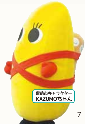
留萌市キャラクター KAZUMOちゃん

北海道の北西部、日本海沿岸に位置する留萌市は、海の幸と美しい景色で知られる港町だ。江戸時代よりニシン漁とともに栄え、現在でもかずの子の加工生産量日本一を誇る。当然、ニシンやかずの子を使った料理や商品も豊富で、お土産選びには事欠かない。他の海産物も豊富で、グルメ垂涎のイベントも多い。 また、海と山に囲まれた自然豊かな地ゆえに、その眺望はどこを切り取っても「映える」ところばかり。たとえば留萌市を含むオロロンラインは、日本海に沈む夕陽が美しいと、絶好のドライブスポットになっている。2020年3月に深川・留萌自動車道の留萌インターチェンジが開業したことにより、アクセスも容易。もはや「行かない」という選択肢はない。