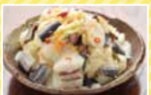
やん衆にしん漬 ニシんのうまみと麴の甘さをぎゅっと詰め込んだニシん漬は田中青果の看板商品。 田中青果 TEL.0164-42-0858