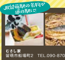
JR留萌駅の名物が道の駅に! ますし家 留萌市船場町2 TEL.090-8705-0721