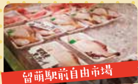
留萌駅前自由市場

留萌市錦町3丁目1-33 TEL.0164-42-0758 9:00~21:00