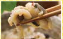
道の駅内そば店 道産産のニシんの甘露煮とかずの子が豪華に入った「しん親子めし」が大人気。たわりの「にしんそば」もおすすめ。