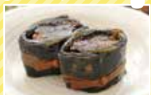
にしんソーラン巻 ニシん一尾分をまるごと巻いている贅沢な昆布巻き。黒糖を加えてコクを出した特製のタレがうまさの秘訣。 丸善うしろ商店 TEL.0164-42-3575

かつては大群が留萌沿岸に押し寄せ、春告魚とも呼ばれたニニシん。今もなお留萌地域ではニニシんを使った商品や料理が多くあり、ぜひ食べてほしい留萌グルメのひとつだ。