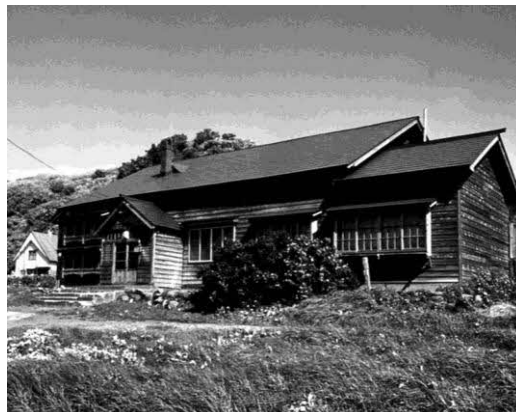
旧佐賀家番屋（留萌市）

昭和23年(1948年)10月天塩郡豊富村を宗谷支庁に分離しました。平成22年(2010年)4月に幌延町が宗谷管内に移管され、留萌支庁の名称は留萌振興局となりました。