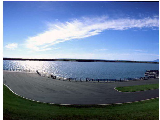
天塩町河川公園 (天塩町)