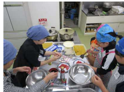
初山別村「子ども・地域生活習慣向上プロジェクト事業 通学合宿」調理体験の様子